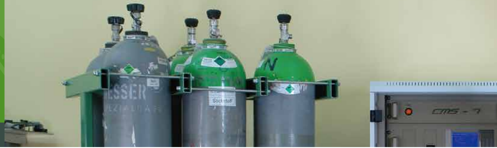
高精度智能配气仪 AIOLOS / Accurate Smart Gas Standard Dilutor AIOLOS